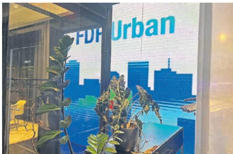
FDP Urban Forum Bern 2020.

«Unsere Vision ist es, liberale und praxisorientierte Lösungen für gegenwärtige und zukünftige Herausforderungen in den Schweizer Städten zu erarbeiten.»