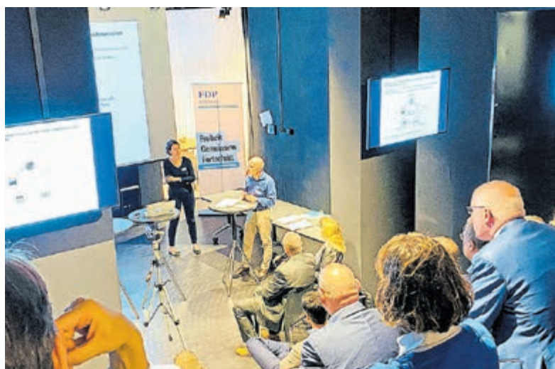
FDP Urban Forum Bern 2020.

«Unsere Vision ist es, liberale und praxisorientierte Lösungen für gegenwärtige und zukünftige Herausforderungen in den Schweizer Städten zu erarbeiten.»