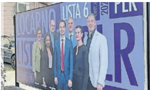
Wahlplakat des PLR Tessin, 2023.