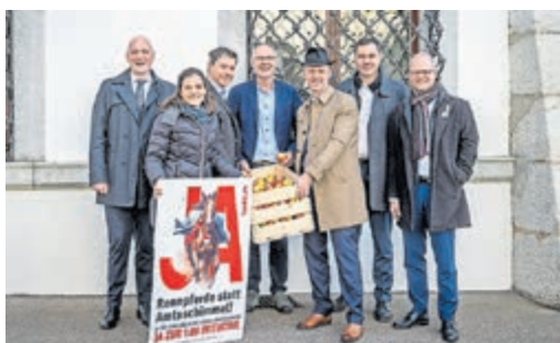
Einreichung der Volksinitiative vor dem Solothurner Rathaus.

Stefan: Wir schauten die Zeitachse an und stellten fest, dass die Stellen beim Staat in den letzten zehn Jahren doppelt so rasch gewachsen waren wie die Bevölkerung. Eine Korrelation zwischen Bevölkerung und staatlichen Stellen herzustellen, fanden wir plausibel, gibt es da doch klare Abhängigkeiten. So kamen wir auf 1:85.