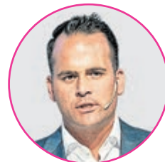
Damian Müller, Ständerat LU und Präsident der ständerätlichen Kommission für soziale Sicherheit und Gesundheit (SGK)

«Die Gesundheitskosten müssen bezahlbar sein, keine Frage. Es ist aber auch unsere Pflicht, dafür zu sorgen, dass unser gutes und geschätztes Gesundheitssystem erhalten bleibt – und zwar für alle.»