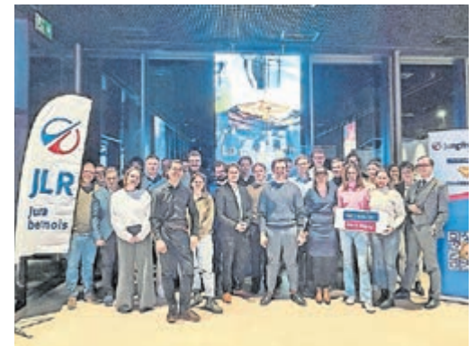
Les membres se remémorent les temps forts de l'année écoulée.

À l'issue de l'assemblée, les invités ont eu l'occasion de déguster un apéritif confectionné par