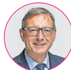
Josef Dittli , Ständerat UR und Mitglied der ständerätlichen Kommission für soziale Sicherheit und Gesundheit (SGK)

gungen vorsieht, bezahlbar ist und den Föderalismus wahrt. Der politische Fokus für die nächsten Jahre muss aber klar sein: Anstelle von Symptombekämpfung sind Reformen innerhalb des Gesundheitssystems gefragt. Wir müssen die Kosten und somit die Prämien mit konkreten und realisierbaren Reformen in den Griff bekommen. Gleichzeitig müssen wir darauf achten, dass die von der Bevölkerung geschätzte Qualität erhalten bleibt.